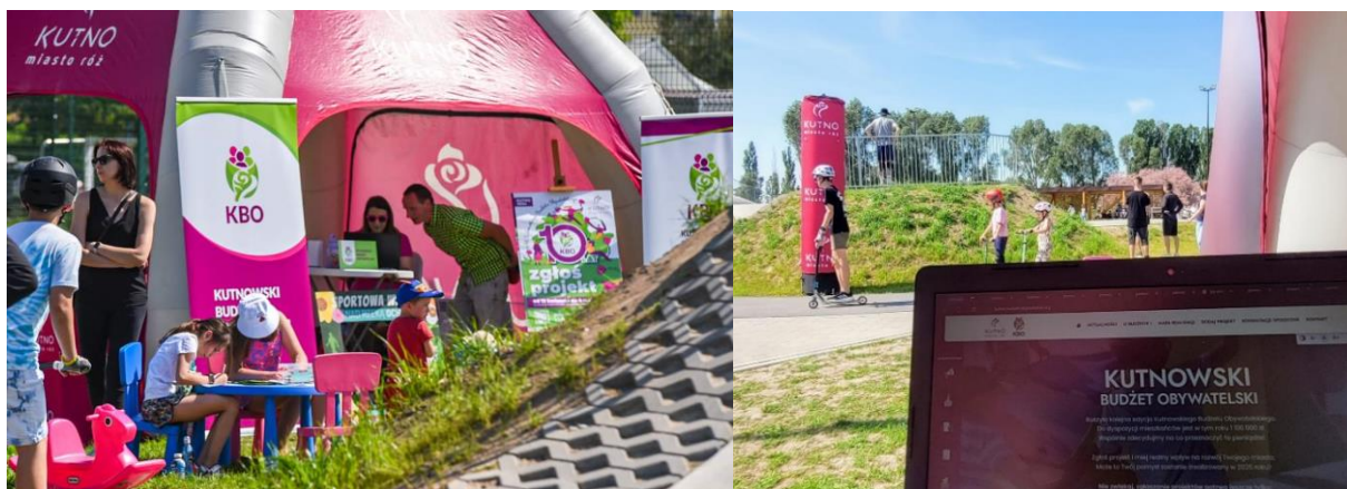
Stoisko KBO podczas Festiwalu Pumptrack Skatepark (4 maja) w parku nad Ochnią

W poniższej tabeli zawarto wykaz wszystkich zgłoszonych projektów w 10. edycji KBO (50 projektów) z podziałem na projekty, które uzyskały pozytywną ocenę na każdym etapie weryfikacji (42 projekty) oraz które uzyskały negatywną ocenę ze wskazaniem na jakim etapie zostały odrzucone i z jakiego powodu (8 projektów).