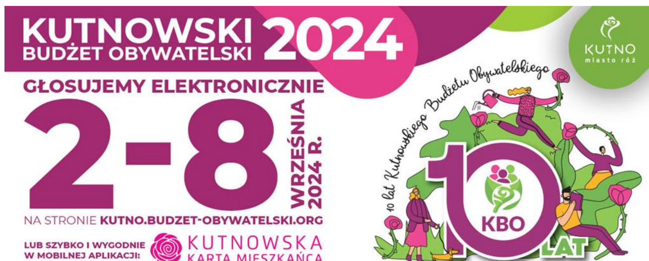
Baner internetowy w lokalnych mediach promujący etap głosowania

Pod głosowanie poddano 42 projekty (w tym: 14 dużych, 15 małych i 13 zielonych). Głosowanie odbywało się w dniach od 2 do 8 września 2024 roku. Mieszkańcy głosowali