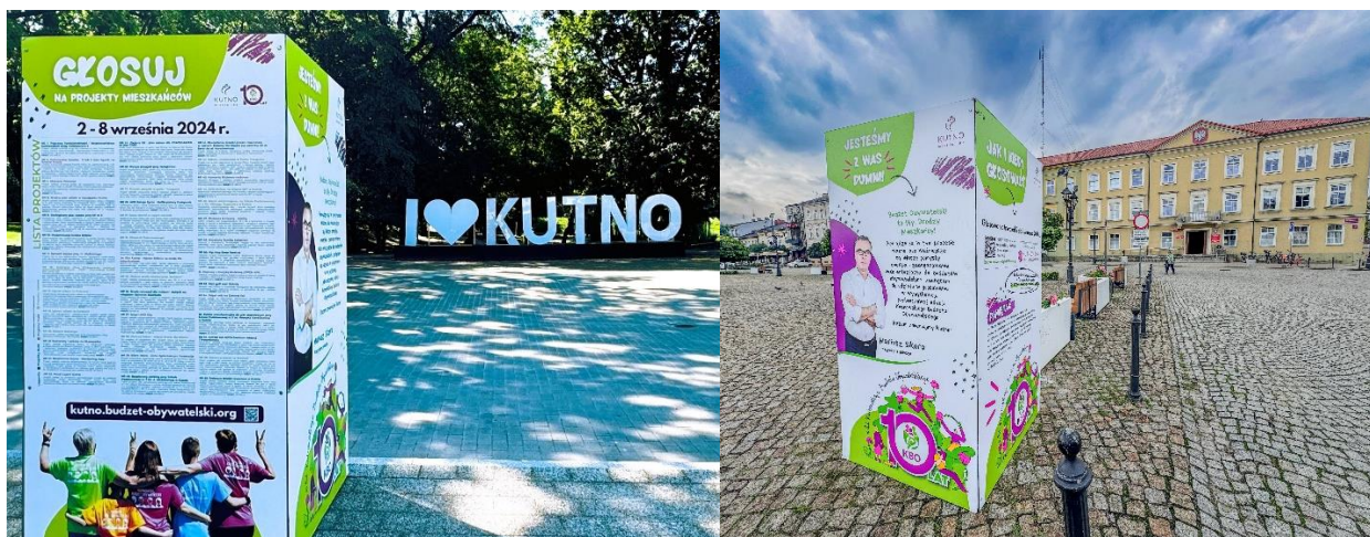
Kubiki informacyjne (pięć lokalizacji: ul. Żółkiewskiego, Pl. Piłsudskiego, ul. Królewska, park nad Ochnią przed pawilonem Strefy Aktywności Miejskiej Zielona ZOśka oraz przed skateparkiem).

W terminie od 6 do 8 września w czasie 50. Świąta Róży w Kutnie, dla mieszkańców utworzono specjalny, plenerowy punkt głosowania, mieszczący się w Parku im. R. Traugutta. W punkcie głosowania pracowały zespoły dyżurujące, składające się z pracowników Urzędu Miasta Kutno. Zespół obsługujący stoisko promował Budżet Obywatelski, udzielał informacji w zakresie idei budżetu partycypacyjnego, zachęcał do aktywnego udziału w głosowaniu w tegorocznej edycji oraz do składania projektów w kolejnym roku. Plenerowy punkt głosowania