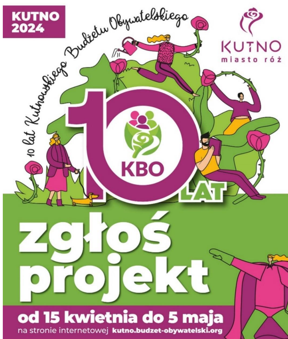
Plakat promujący etap składania projektów do 10. jubileuszowej edycji Kutnowskiego Budżetu Obywatelskiego

W dniu 15 kwietnia 2024 roku, kiedy to oficjalnie wystartowała 10. jubileuszowa edycja Kutnowskiego Budżetu Obywatelskiego, rozpoczęła się szeroka kampania informacyjna i promocyjna. Informacje o rozpoczęciu konsultacji społecznych pojawiły się na stronach internetowych oraz na stronach Facebook Urzędu Miasta i Kutnowskiego Budżetu Obywatelskiego, w lokalnej prasie i w radio. Akcja promocyjna polegała również na ekspozycji plakatów zachęcających do składania projektów oraz przygotowano specjalny spot reklamowy, promujący etap składania projektów, który był emitowany w lokalnej rozgłośni radiowej.