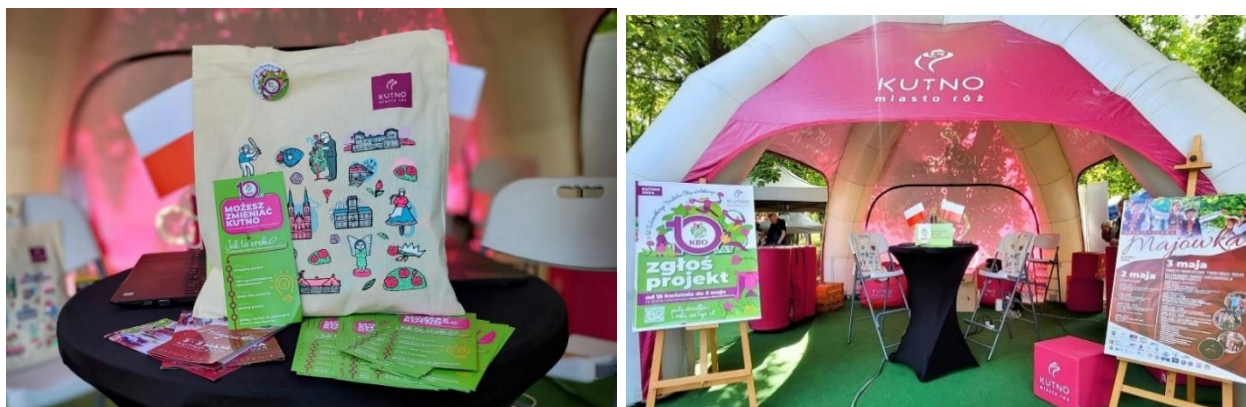
Stoisko KBO podczas patriotycznej majówki (3 maja) w parku im. R. Traugutta

W czasie weekendu majowego działały dwa plenerowe punkty Kutnowskiego Budżetu Obywatelskiego, w których mieszkańcy mogli zgłosić projekt. Pierwszy punkt działał 3 maja podczas patriotycznej majówki w parku im. R. Traugutta, drugi 4 maja, w parku nad Ochnią podczas wydarzenia sportowego przy skateparku.